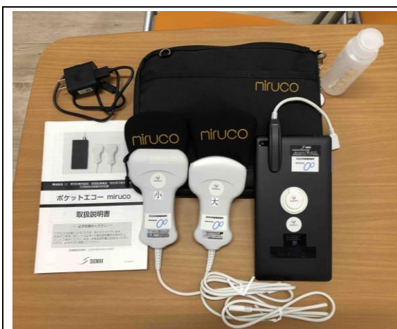
(2) ポータブル超音波画像診断装置

( https://www.sigma-med.jp/medical/products/5087 )