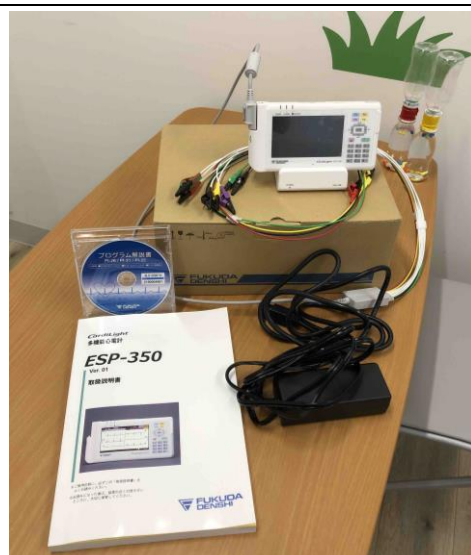
(3) ポータブル心電計

( https://www.sigma-med.jp/medical/products/5087 )