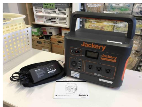
(4) ポータブル電源 1台目

( https://www.fukuda.co.jp/medical/products/ecg/esp_350.html )