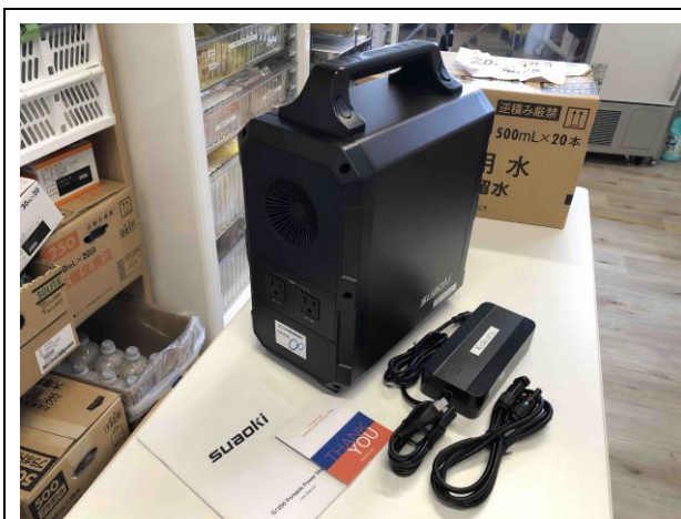
(5) ポータブル電源 2 台目

( https://m-jp.suaoki.com/suaoki-g1200/sk_1826266_027827373767.html )